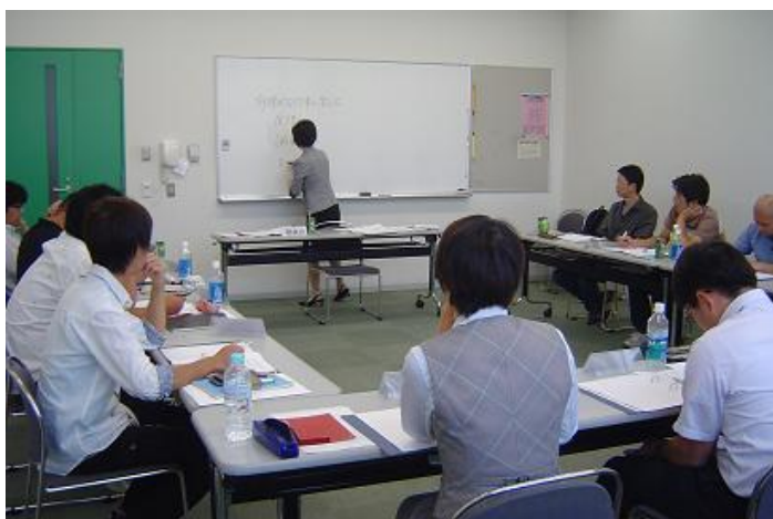
少人数制なので、その場で質問も受け付けます。