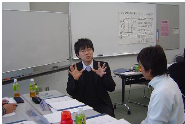
ロールプレイング中心の体験型研修です。